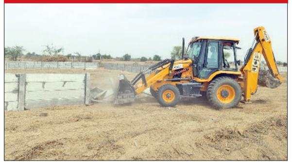
रेवाड़ी। अवैध कॉलोनी का निर्माण तोड़ती जेसीबी।

दो एकड़ जमीन पर विकसित अवैध कॉलोनी ध्वस्त