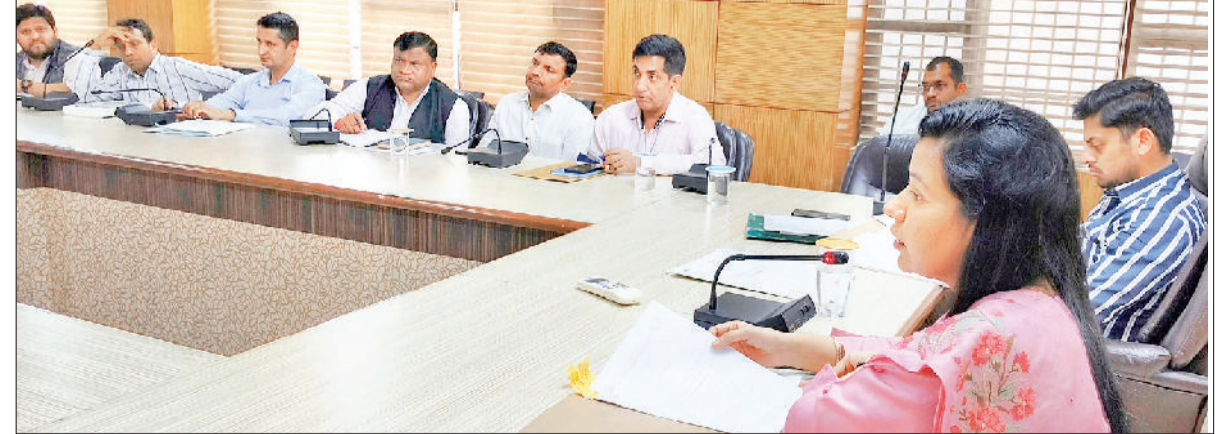
नारनौल। अधिकारियों की बैठक लेती डीसी मोनिका गुप्ता।

मिले तो तुरंत प्रभाव से कार्रवाई की जाए। अवैध खनन में संलिप्त किसी भी नागरिक को छोड़ा नहीं जाएगा। सूचना के लिए संबंधित सरपंचों का सहयोग लिया जाए। पंचायती जमीन पर किसी भी अवैध गतिविधि को रोकना सरपंचों की जिम्मेदारी होती है। अधिकारियों को निर्देश दिए कि जिले में पर्यावरण को संरक्षित रखने के लिए कार्य योजना तैयार की जाए। इसमें जल संरक्षण तथा ग्रीन एरिया बढ़ाने आदि पर कार्य किया जा सकता है। उन्होंने कहा कि यह कार्य योजना तैयार करने के लिए एडीसी को नोडल ऑफिसर बनाया गया है।