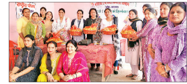
महेंद्रगढ़। वार्ड नंबर में आयोजित गोद भराई कार्यक्रम में भाग लेती महिलाएं।