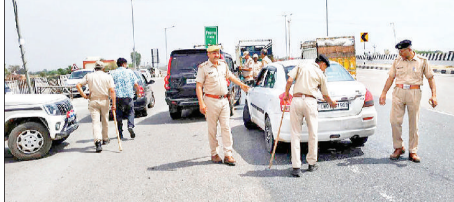
नारनौल। राजस्थान बॉर्डर पर गाड़ी की जांच करती पुलिस।