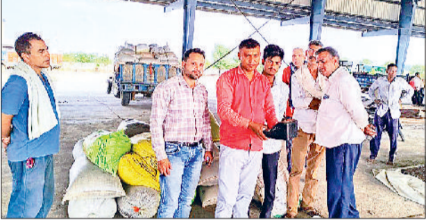
नारनौल। मंडी लाई गई सरसों की नमी मापते खरीद कर्मचारी व अधिकारी व नांगल चौधरी मंडी में सरसों की खरीद करते एजेंसी के अधिकारी।

अटेली में 272 व नांगल चौधरी में 67.5 विवंटल सरसों की खरीद, नारनौल में टोकन तो खरीदे, परंतु तीसरे दिन भी नहीं हुई खरीद, किसानों को उठानी पड़ रही परेशानी अधिक नमी बताकर पल्ला झाड़ रहे खरीद एजेंसियों के अधिकारी