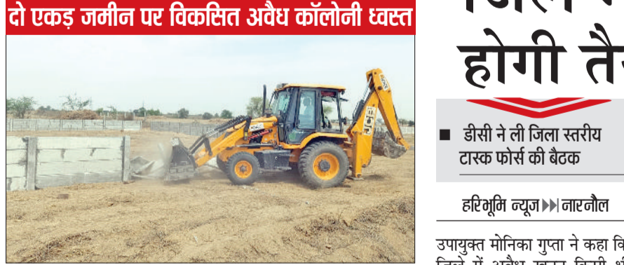
रेवाड़ी। अवैध कॉलोनी का निर्माण तोड़ती जेसीबी।

डीटीपी मंदीप सिंह सिहाग के आदेश पर विभाग की टीम ने वीरवार को शहरी क्षेत्र में विकसित की जा रही अवैध कॉलोनी पर कार्रवाई की। इससे प्लांटिंग करने वाले लोगों में खलबली मच गई। पुलिसबल की मौजूदगी में डीटीपी की कार्रवाई का कहीं विरोध नहीं हुआ। एक ओर जहां सरकार ने पिछले दिनों काफी अनियमित कॉलोनियों को नियमित करने की दिशा में कदम उठाया है, वहीं दूसरी ओर कॉलोनाइजर व डीलर नई कॉलोनियां विकसित करने में लगे हुए हैं। डीटीपी के निर्देश पर पुलिसबल व इयूटी मजिस्ट्रेट के साथ टीम ने जेसीबी की सहायता से रामगढ़ रोड पर 2 एकड़ जमीन पर विकसित की जा रही अवैध कॉलोनी को ध्वस्त कर दिया। टीम ने 6 डीपीसी व 12 चारदीवारी आरसीसी को जर्मादेज कर दिया। इसके अलावा कच्चे रोड नेटवर्क पर भी तोड़फोड़ की कार्रवाई की।